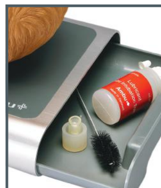
Tiroir pour rangement des accessoires