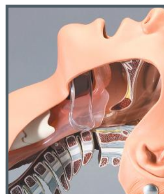
Inclinaison de tête