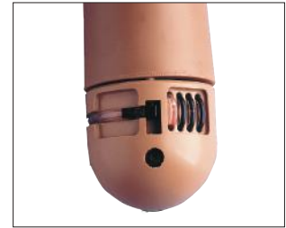
Reservoir en indicatie paneel dat iedere gevulde bloedvat voorstelt