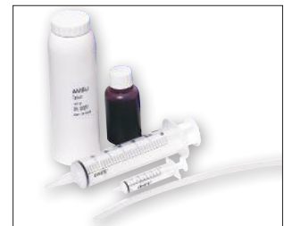
Accessoires voor infuusarm Ambu IV Trainer